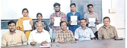
జాబ్ మేళాలో ఉద్యోగాలకు ఎంపికయిన విద్యార్థులు